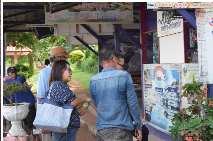
ชมรมเรือนำเที่ยวหาดสลึง