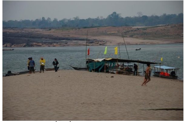
ท้องเที่ยวหาดสลึง หนองดี (2551) และจุดลงเรือนำเที่ยวที่หาดสลึง