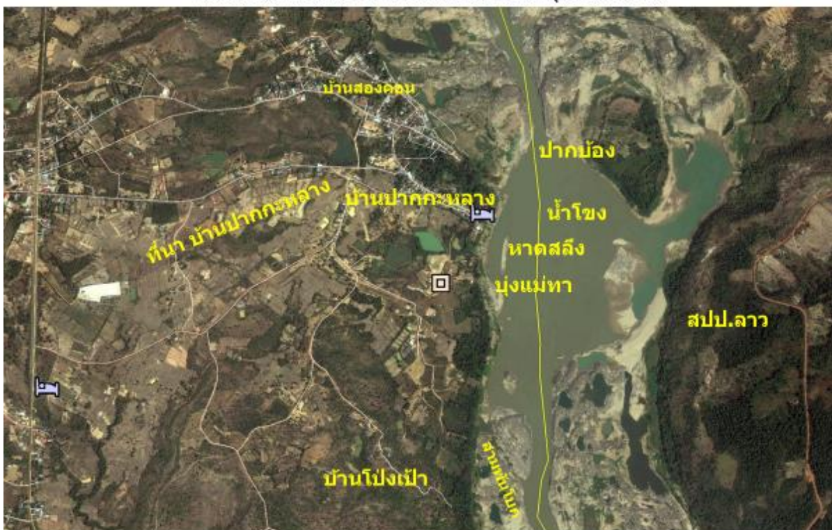
แผนที่แม่น้ำโขง ที่บ้านปากกะกลาง จ.อุบลราชธานี

แม่น้ำโขงที่บ้านปากกะกลาง มีลักษณะเป็นเวินขนาดใหญ่ ที่เชื่อมต่อระหว่างปากบ้อง ของบ้านสองคอน กับลานหินขนาดใหญ่ (หรือสามพันโบก) ของบ้านโป่งเป้า มีหาดขนาดใหญ่ยื่นออกไปเป็นรูปครึ่งวงกลม หรือเรียกกันว่า หาดสลิ้ง จะปรากฏให้เห็นชัดเจนในฤดูแล้ง เป็นสถานที่จอดเรือประมงของชาวบ้าน และด้านท้ายหาดมีบึงแม่ทา ชาวบ้านปากกะกลาง ทำการประมงทั้งในพื้นที่ของตนเอง และในเขตบ้านสองคอน บ้านปากกะกลางด้วยเช่นกัน เนื่องจากระบบการจับปลาของชาวบ้าน ไม่ได้แบ่งแยกตามขอบเขตการปกครอง