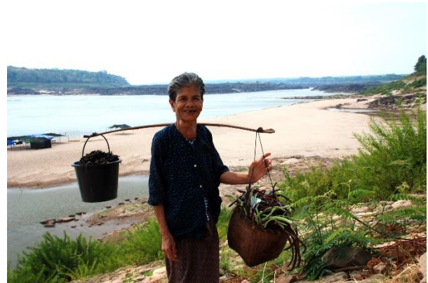
เรือประมงของชาวบ้านปากกะกลาง และแม่ใหญ่เก็บผักจากสวนผักริมน้ำโขง