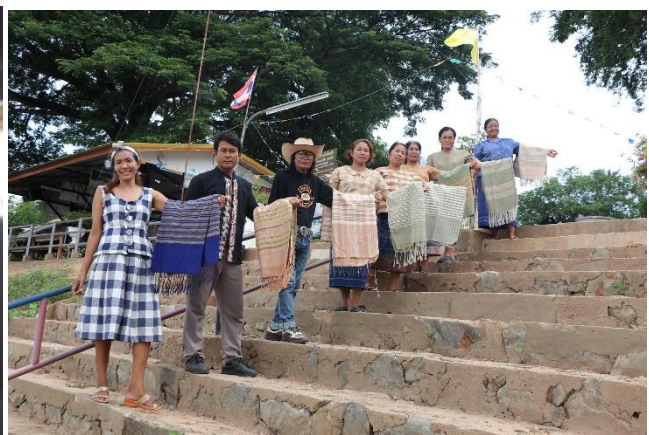
ภาพผลิตภัณฑ์ผ้าพื้นเมืองและปลาร้า จากเพจ กลุ่มทอผ้าบ้านปากกะหลาง