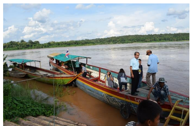
การล่องเรือนำเที่ยว